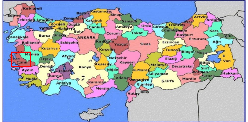
Harita 1 - İzmir'in Konumu

Ege kıyı bölgesinin tipik bir örneği olan İzmir, kuzeyde Madra Dağları, güneyde Kuşadası Körfezi, batıda Çeşme Yarımadası'nın Teke Burnu, doğuda ise Aydın-Manisa il sınırları ile çevrilmiş, 11.973 km 2 'lik bir alana yayılmıştır. İzmir, Ege Bölgesi'nin en büyük, ülkemizin de üçüncü büyük ilidir.